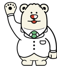
鹿児島市薬剤師会 公認キャラクター 「ふあーくま先生」